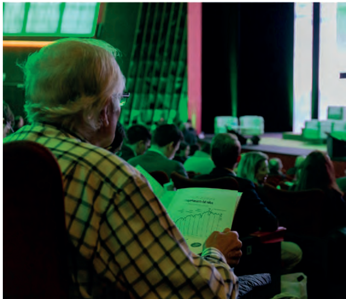
Cuarta Conferencia Anual de Inversores.

Hemos renovado nuestra página web de Planes de Pensiones, la cual puede visitar a través del siguiente enlace .