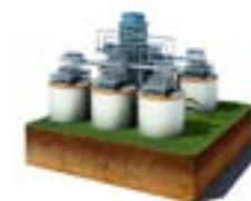
Generación de energía