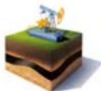
Exploración y producción