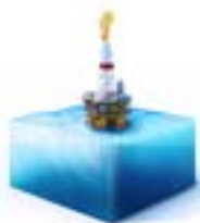
Exploración y perforación