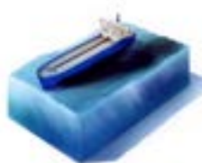
Producción y licuefacción